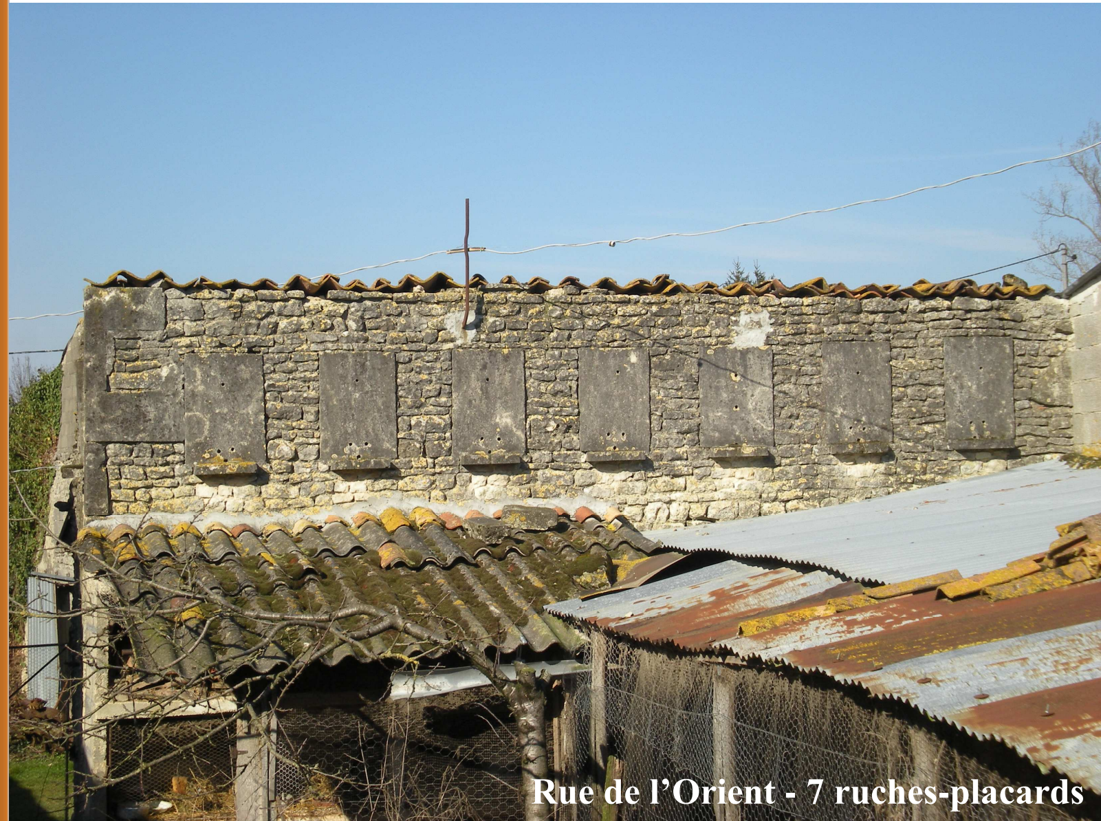
Rue de l'Orient - 7 ruches-placards

Distance 9,5 km - Durée 2h30 - Balisage bleu